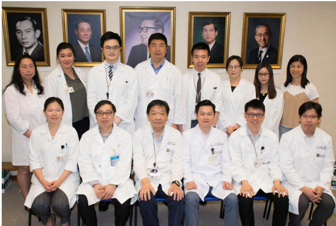
与关节置换外科组合照 (2017-10)

（很遗憾的是在我刚回到包头，由于手机进行了系统升级变慢，重新刷机，备份的资料未能保存好，最后只找到的我在香港期时电脑备份的一个文件，手机只能恢复到了12月6日的状态，损失很大，尤其是到最后寻段时间留存的资料包括与后期与大家的合影，很心痛啊！）